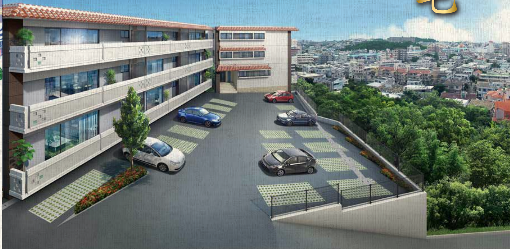
完成予想図/この絵図は、図面を基に描き起こした建物完成予想図と周辺写真(平成28年9月15日撮影)をCG処理により合成したもので、実際とは多少異なります。

人と自然、地域が美しく調和する古都、首里の御殿山を舞台に始まる邸宅の暮らし。 それは、住まう方の価値観やライフスタイルを導くだけでなく、新しい喜びに出会える豊かさに満ちた日常。