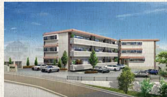
完成予想図/この絵図は、図面に基に描き起こしたもので、実際とは多少異なります。