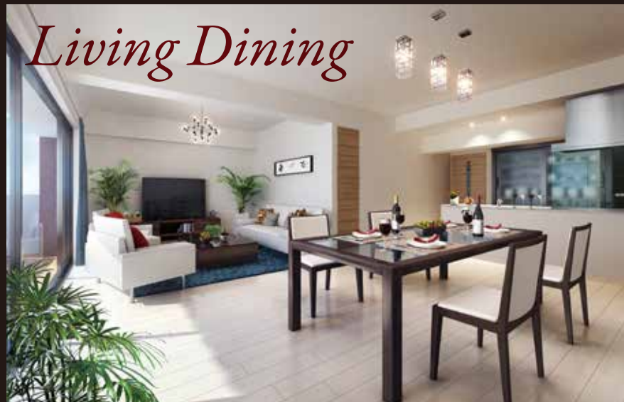
室内完成予想図/この絵図は、図面に基に描き起こしたもので、一部CG処理を施しており実際とは多少異なります。

居住面積を大きくとったワイド設計の住空間と気品溢れるラグジュアリーな上質仕様です。